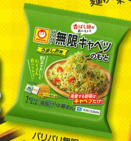
パリパリ無限 キャベツのもと