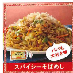
スパイシーそばめし