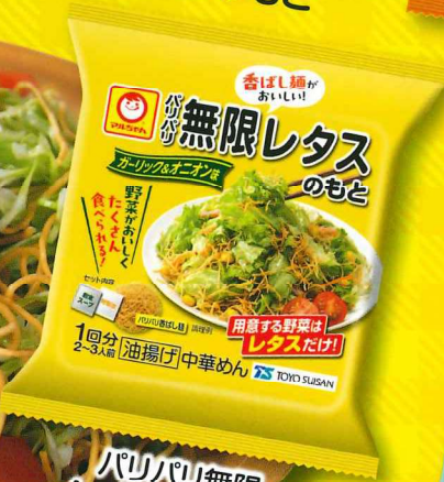
パリパリ無限 レタスのもと