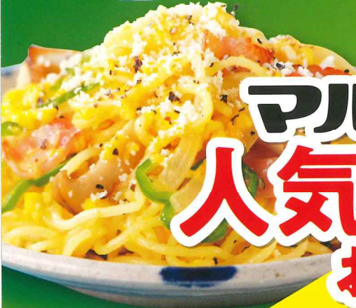
焼そば カルボナーラ