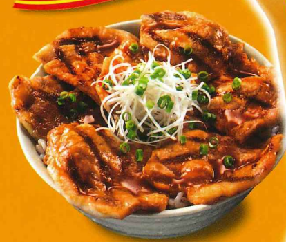
※写真は味のイメージです