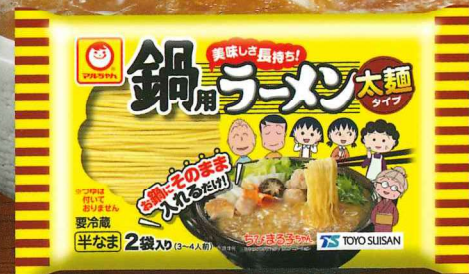
鍋用ラーメン 太麺