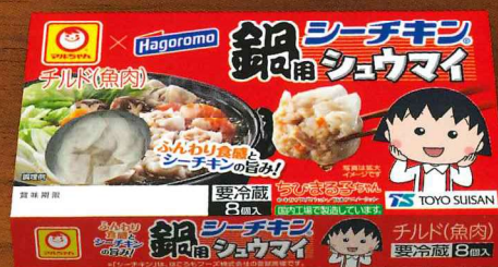
鍋用シーチキンシュウマイ