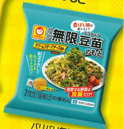
パリパリ無限 豆苗のもと