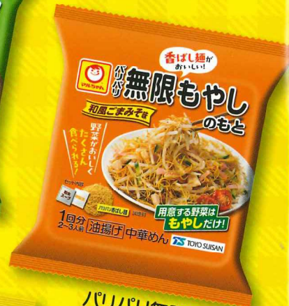
パリパリ無限 もやしのもと