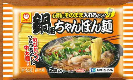
鍋用ちゃんぽん麺