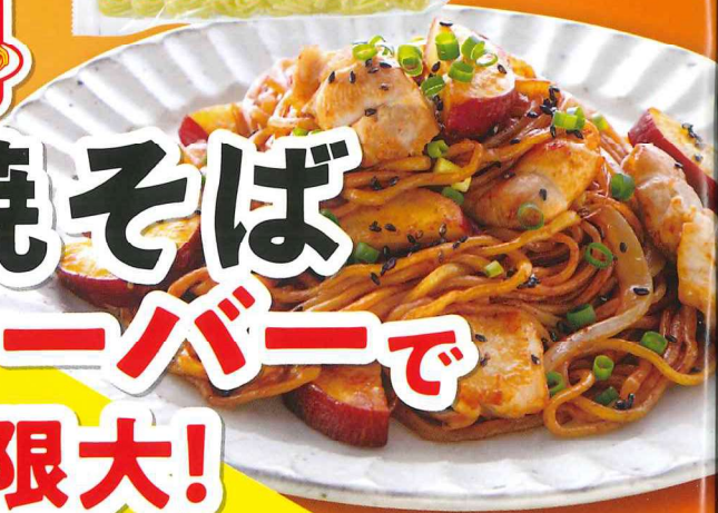
鶏とさつまいもの 黒ごま焼そば