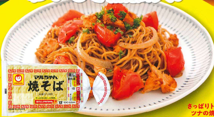
さっぱりトマトと ツナの焼そば