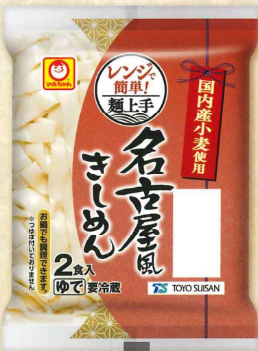
名古屋風きしめん